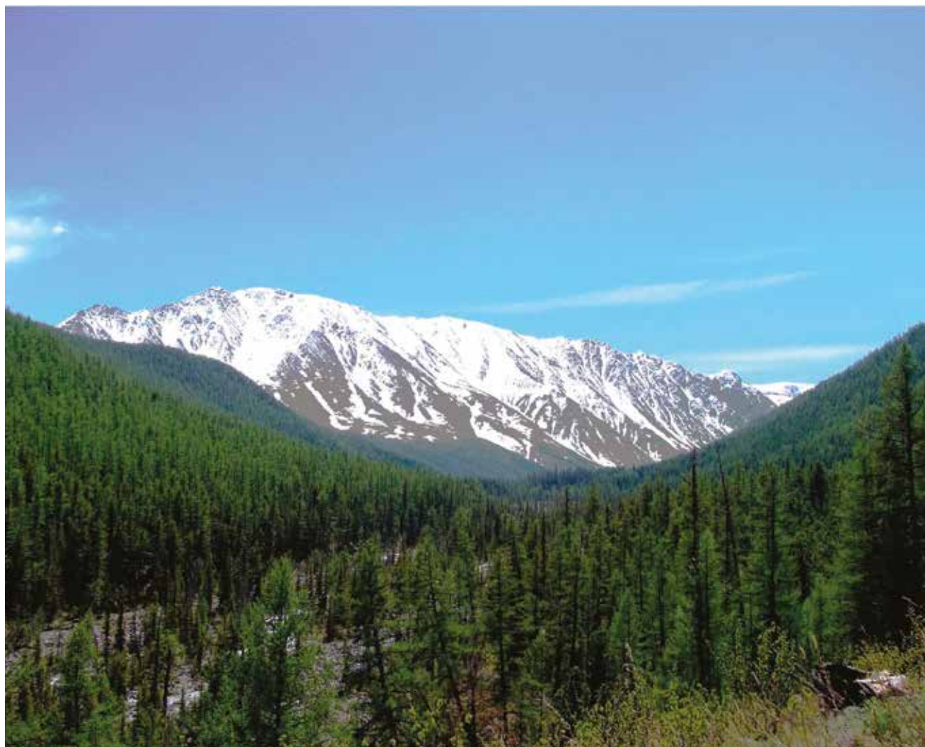
Алтай, Курайский хребет.

С обширной Западно-Сибирской равнины поднимаются на восток её горные массивы. Древний, поросший тайгой Салаирский кряж, солнечный Горный Алтай — «золотые горы» Сибири, дикие, слабо