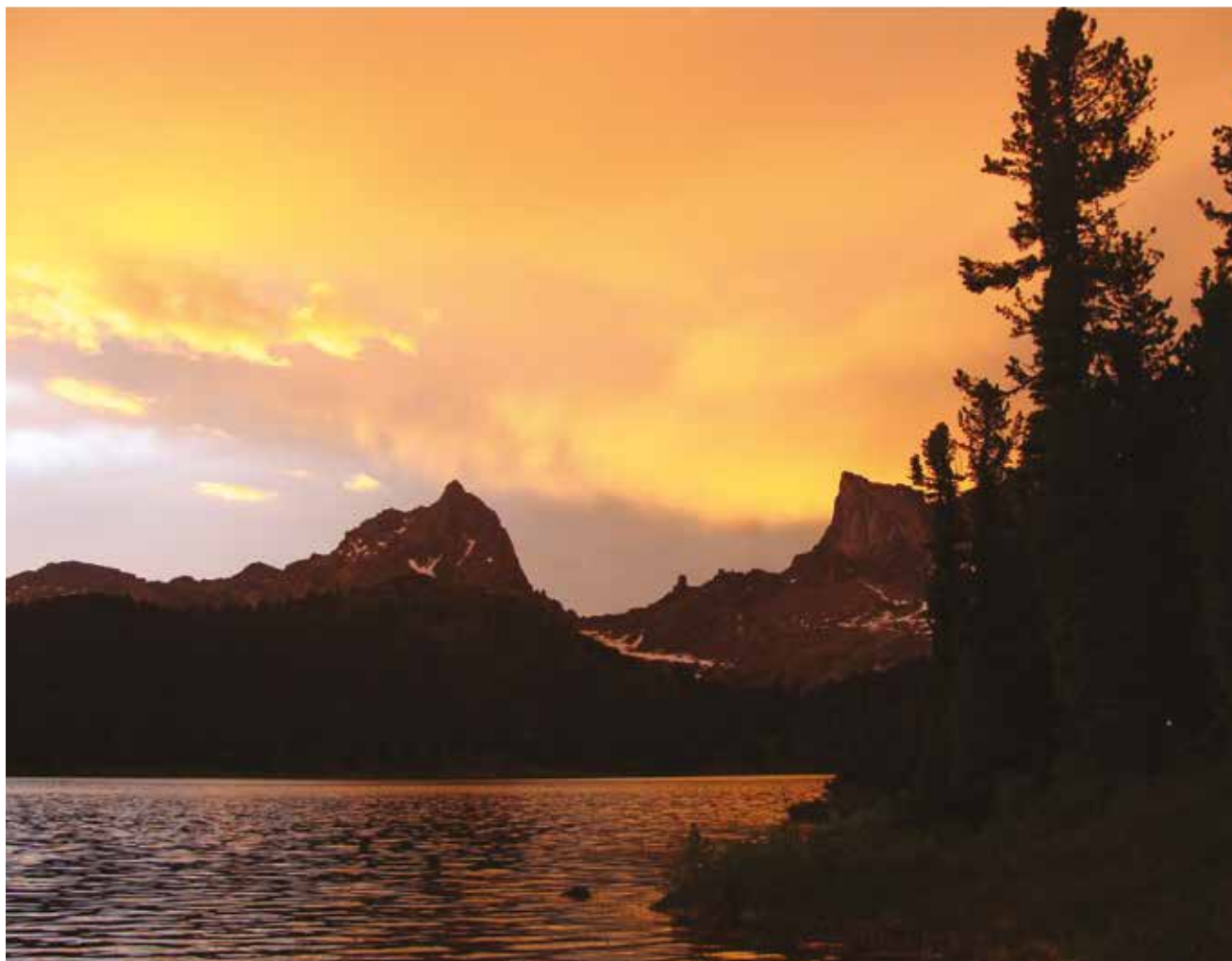
Западный Саян, озеро Светлое в природном парке Ергаки.

Природный парк Ергаки в Западном Саяне – один из удивительных горных уголков юга Сибири, где есть снежники, высокогорные луга, глубокие озёра, оставленные ледниками, остроконечные пики гор. Однако в среднем эти горные массивы ниже, чем Горный Алтай. Максимальных высот достигает пик Мунку-Сардык в Восточном Саяне – 3 491 метр.