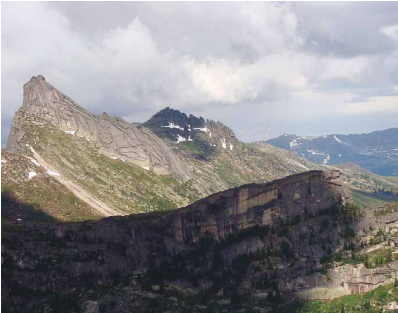
Западный Саян, пик Звездный в природном парке Ергаки.

В горах Алтая берёт свое начало река Катунь – крупнейший приток Оби, главной водной артерии Западной Сибири. Появляясь небольшим горным ручьём на склоне Белухи, река вбирает в себя