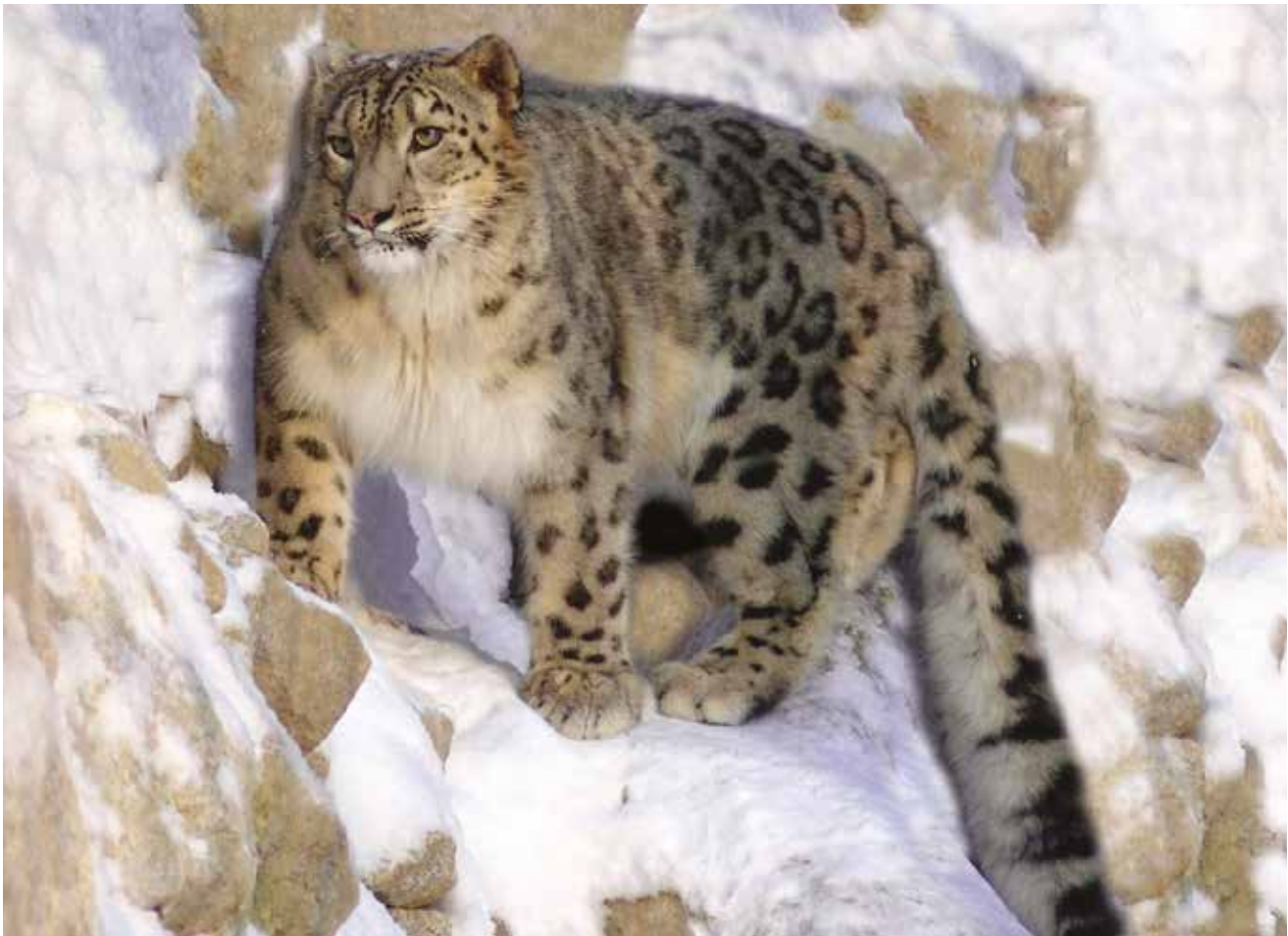
Снежный барс.

Снежный барс, или ирбис, – одно из самых неуловимых животных на нашей планете. Никто не знает, сколько их живёт в горах центра Азии. Эти крупные представители семейства кошачьи предпочитают высокогорные пустоши, каменистые склоны ущелий. Заметить барса среди скал очень сложно, окрас из тёмных пятен на серо-коричневом фоне делает его практически невидимым в горах. А густой высокий (до 55 миллиметров длиной) мех позволяет ему комфортно себя чувствовать в заснеженных горных долинах.