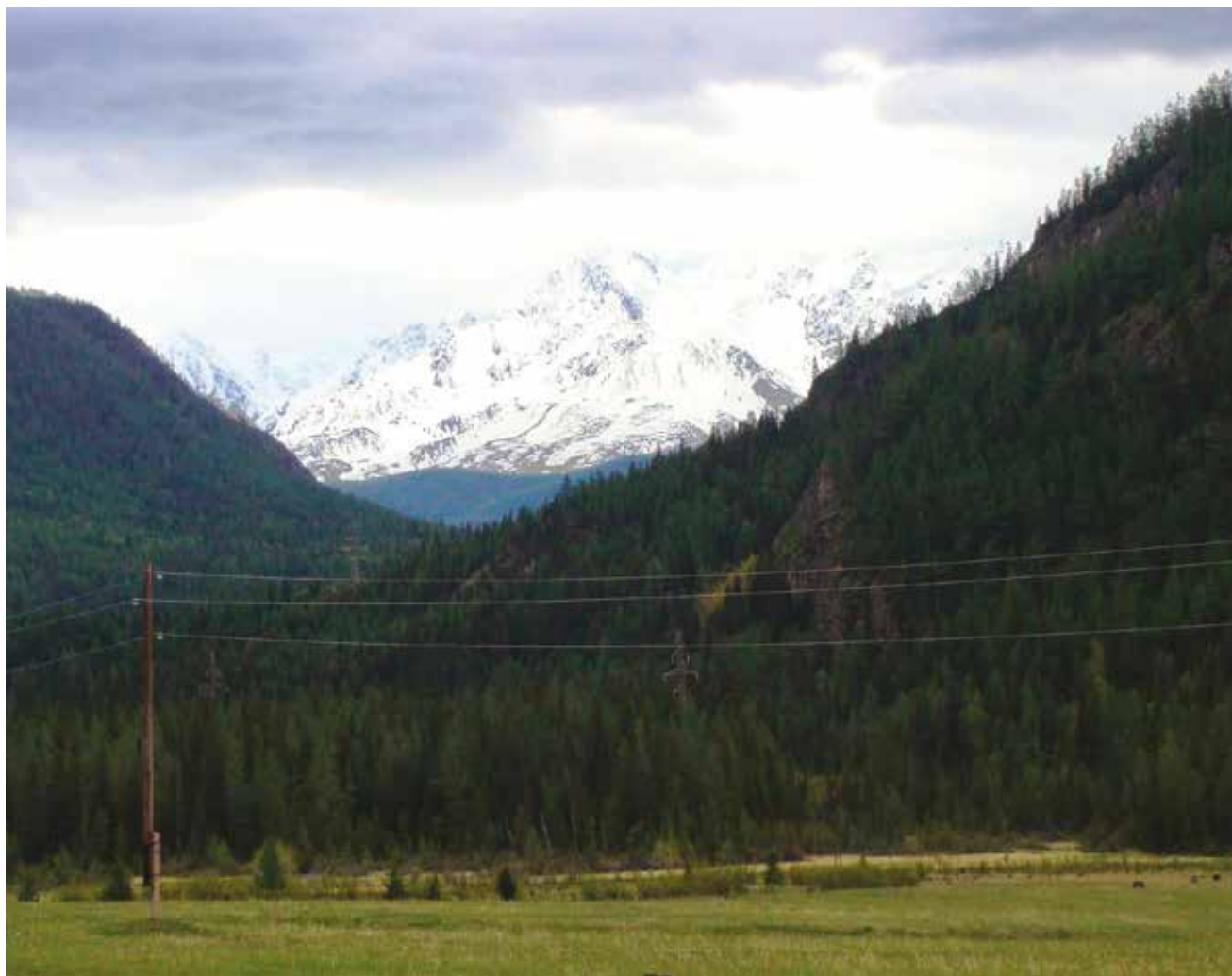
Алтай, Катунский хребет.

Общая площадь этой горной страны составляет 1 065 300 квадратных километров, что сопоставимо с площадью Арабской Республики Египет. Протяженность с запада на восток 1 600 километров, с севера на юг 1 300 километров. Формирование современного рельефа Алтае-Саянской горной территории началось в начале четвертичного