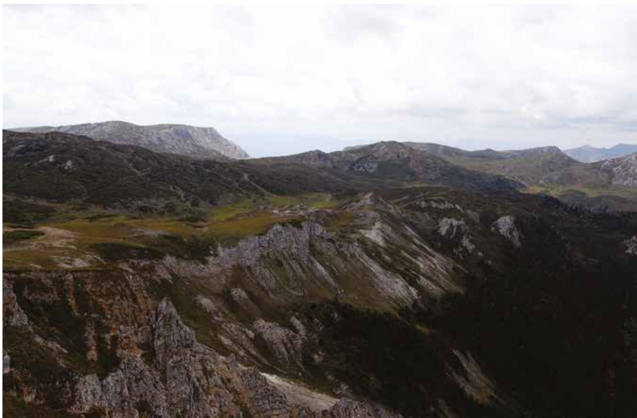
Окраина Тибетского нагорья.