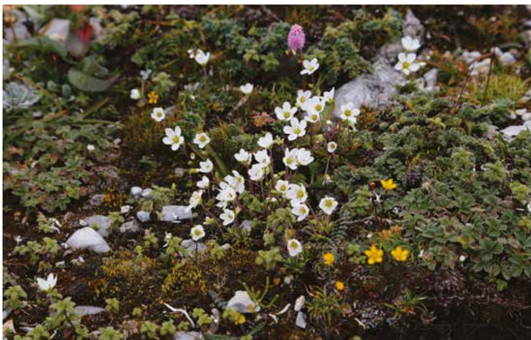
Цветущие растения в высокогорьях Тибета.

юго-восточных частях Тибета можно выращивать и другие культуры. Значительное место в доходах местного населения занимает сбор и продажа своеобразных грибов из рода кордицепс, очень популярных в тибетской медицине.