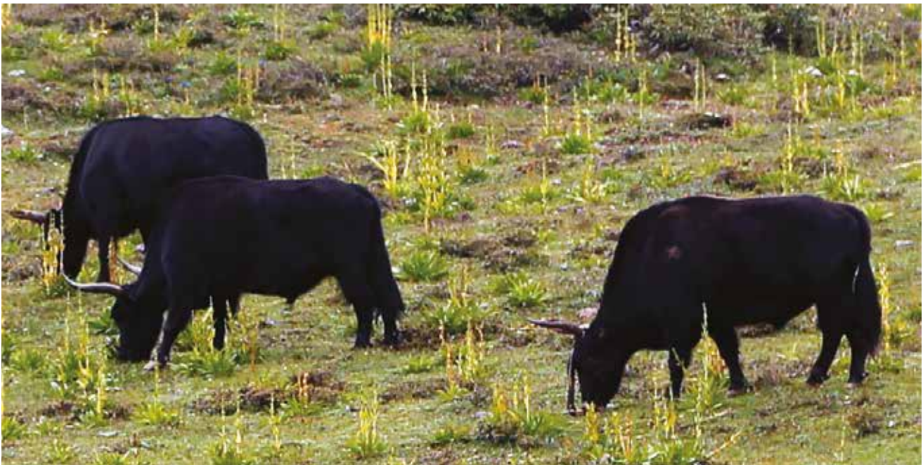
Яки в высокогорьях Тибета.

Именно як стал единственным видом млекопитающих, одомашненным только в Тибете. Считается, что это произошло более 2 тысячелетий назад. Домашние яки меньше и спокойнее диких. С человеком они расселились и в другие горы центра Азии: Памир, Тянь-Шань, Алтай, Саяны... Домашние яки – незаменимые в высокогорьях вьючные животные, а в земледельческих районах их используют и во время пахоты. Для местных жителей яки – ценнейшие животные, которые, с одной стороны, почти не требуют ухода, а с другой – дают молоко, из которого делают сыры и масло, а также качественную шерсть. В пищу используется и их мясо, а высушенный навоз служит топливом.